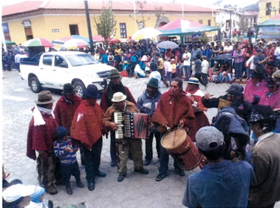
Participarían de Danza y música de los titulares de derechos