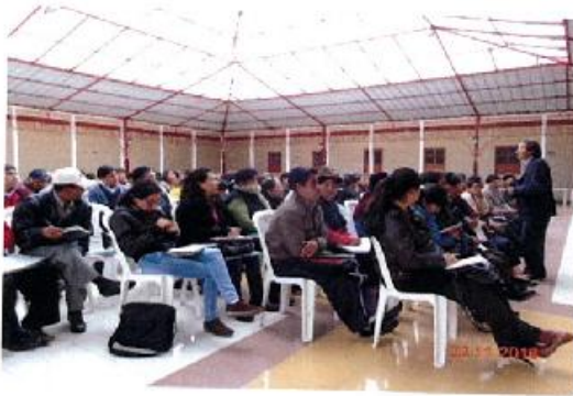
Imparte metodología de escuelas lectoras