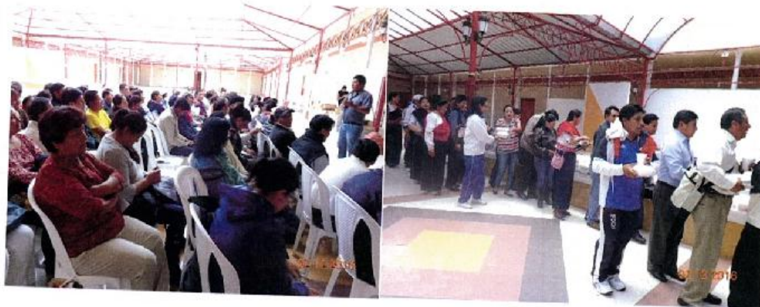
Fuente; Fotografía: 11,12/02/2016