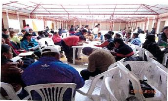
Ponencia de los grupos.