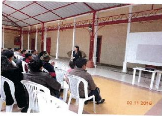
Anexo.- Palabras de bienvenida Técnica PDA N° de maestras, maestros. Tixán Achupallas.