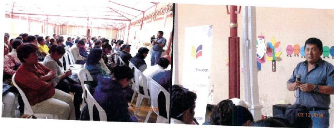
ANEXO: . Ponencia del Técnico del MIES.