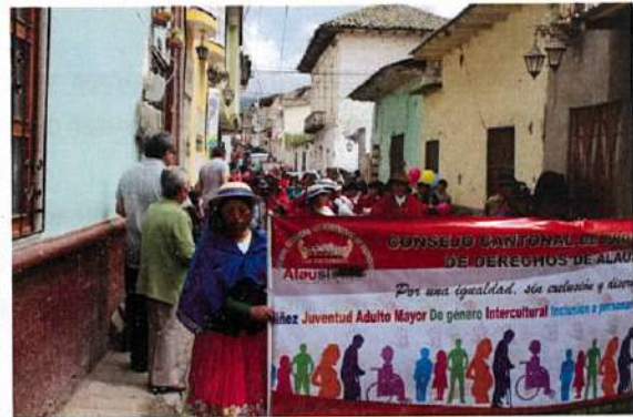
Concentración y salida del desfile de parque 13 de noviembre por la calle bolivar.