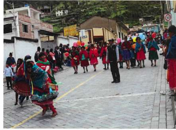
En el recorrido del desfile por la calle estaban Orozco y avenida 5 de junio llegando hasta la plazuela Guayaquil.