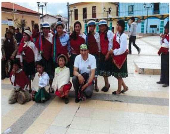
Final de la participación.